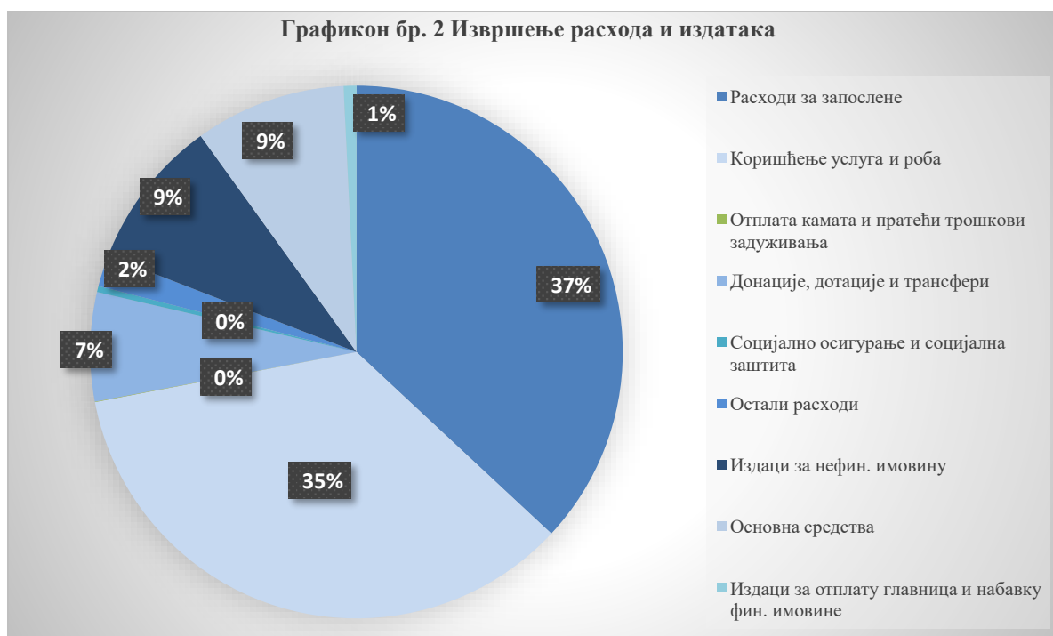
Графикон бр. 2 Извршење расхода и издатака